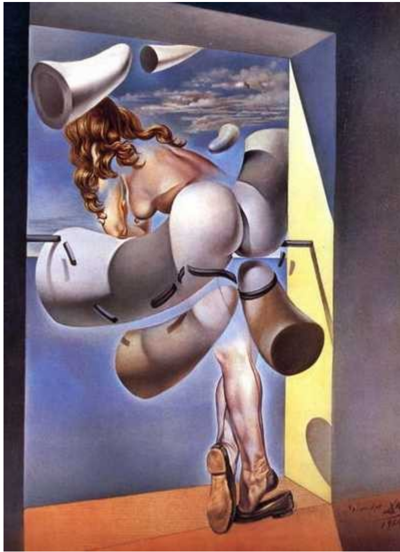
Юная девственница, которую содомирует ее собственная непорочность. Сальвадор Дали.

Физиологическая реакция, которую вам в идеале необходимо обрести, представляет собой продолжительное истечение простатической жидкости (в просторечии именуемой «смазкой») из эрегированного пениса, одновременно с полным сохранением состояния сексуального напряжения. Регулярно практикуясь, вы, в конце концов, научитесь точно выбирать момент для эякуляции; эта фаза оргазма перестанет быть для вас неожиданной. Довольно часто бывает, что собственно семяизвержение длится намного дольше обычного после того, как вы растянете предшествующую ему стадию оргазма, и сопровождается оно более яркими ощущениями, чем всегда. Контроль над этим аспектом половой реакции не только сильно разовьет ваши физические способности к сексуальной магии на необходимо-высоком уровне возбуждения и в состоянии измененного сознания; еще он даст вам необходимый навык завершения оргазма в выбранный момент времени для ваших будущих сексуально-магических операций.