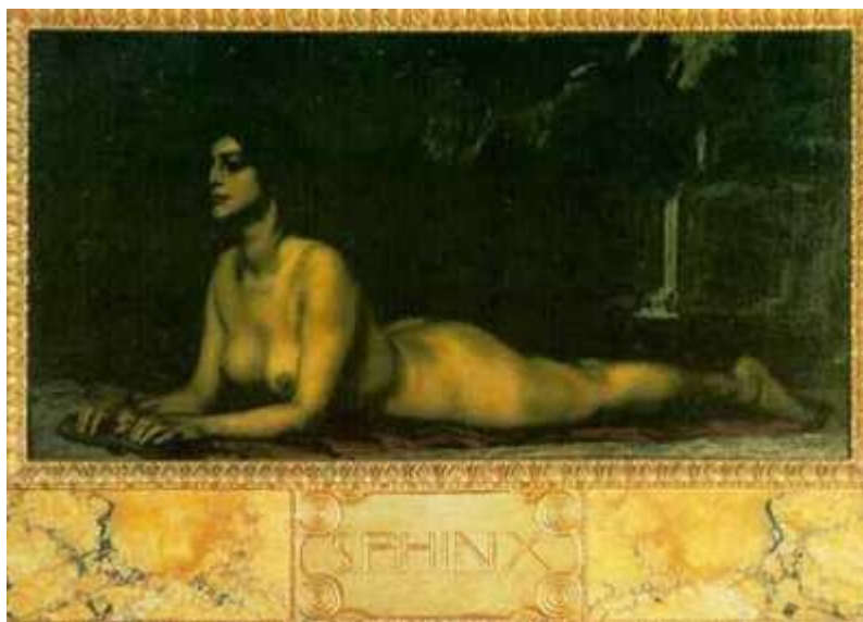
Сфинкс; Франц фон Штук

Посвящаемые-мужчины настолько устремлены к Шакти, что в прямом смысле слова ищут путь к пробуждению ее в своем теле и психике. Адепт пути левой руки осознает, что женщины по природе своей наделены загадочным даром магии, прорицания и других черных искусств. Сходство между скандинавской традицией вольвы, женщины-оракула, и культом змеи у предсказательниц Древней Греции свидетельствует о том, что еще с архаичных времен магическая сила мыслилась как имеющая изначально-женскую природу. Потому мужчины-адепты пути левой руки жаждут обрести в себе часть этой женской сути; и данная практика не ограничивалась одной Индией. К примеру, едва ли не во всех культурах шаманы традиционно используют женскую символику, каковая должна помочь им в их визионерских странствиях; это прекрасное доказательство в пользу универсальности принципов пути левой руки.