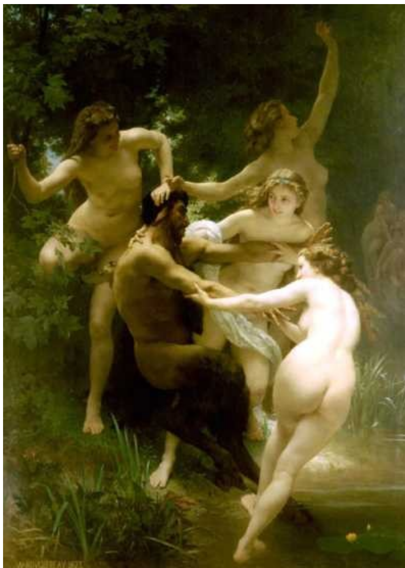
Нимфы и сатир. Бужеро.

Подражание неистовству менад – в античные времена их еще называли «суками Диониса» – зарекомендовало себя как крайне ценный метод для сегодняшних сексуальных доминатрикс, особенно в добровольном ритуале «изнасилования» пассивных партнеров мужского или женского пола. Экстатический танец – иногда приводивший к озарениям или предвидениям – был почти повсеместным отличительным признаком менад; этот физический прием и сегодня можно использовать современным магам для вхождения в транс. Эквивалентной ценностью обладает для сегодняшних магов-мужчин образ сатиров с их постоянной эрекцией, которые следовали в вакханальном шествии, а также образ самого Диониса, о магических корнях которого мы рассказывали, когда анализировали Кундалини.