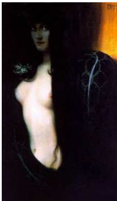
Грех. Франц фон Штук.

Сходные с Кундалини концепции встречаются в самых разных эзотерических традициях мира, что свидетельствует о том, что тантризм – не более чем локальное осмысление некоего универсального явления. Размышления о феномене кундалини появились в западной герметической литературе задолго до того, как знание о пути левой руки попало в Европу. Змей Кадуцей – хорошо известный символ змеевидной женской сексуальной энергии в герметизме и алхимии. Более конкретно – Гихтель, ученик немецкого мистика Якоба Бёме, писал в 1696 году в своем трактате «Teosophia Practica» («Практическая теософия») о несущем просветление «змеевидном огне», локализованном в основании позвоночника. Такого рода замечания европейцев о змееподобной расширяющей сознание неизвестной энергии, каковая находится в человеческом теле, показывают, что опыт активизации кундалини был известен далеко за пределами Индии. В описании Гихтеля этот позвоночный огонь принимает форму могучего дракона. Дракон как хранитель тайной женской мудрости есть мифический символ, встречающийся помимо европейского фольклора в месопотамской легенде о богине Тиамат, на основе которой позднее сложилась библейское предание о драконе Левиафане, чудовище из «Откровения».