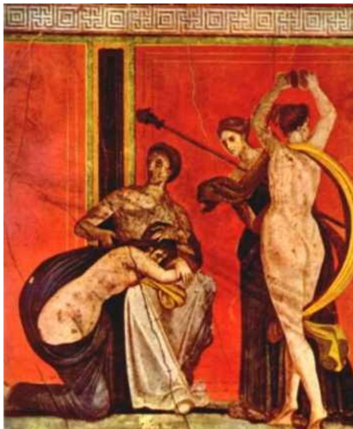
Ритуальное бичевание. Вилла Мистерий. Помпеи.

Немногие из иных магических методик способны превратиться в такое могучее оружие для обуздания материи и субстанции физического и психического как групповая сексуальная работа. Но поскольку всякое оружие опасно в той же мере, что и эффективно, оргиастическая магия требует аккуратного обращения с ее взрывной силой, и тогда она даст максимальные результаты.