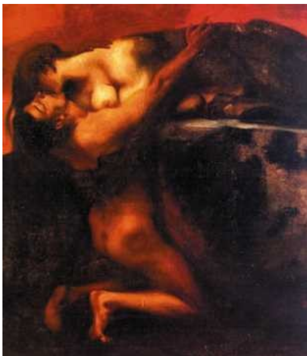
Поцелуй Сфинкса. Франц фон Штук.

Массовый синдром, заставляющий столь многих мистиков и магов отворачиваться от материального мира как от отвратительной и грязной заразы, пути левой руки совершенно чужд. Адепт должен не презирать иллюзорность майи, видя в ней гибельный морок, от которого следует усердно отстраняться через очищение аскетизмом, а прославлять ее, узнавая в ней восхитительную манифестацию женской силы. Собственно говоря, призрачная, но, как ни парадоксально, реальная субстанция мира воспринимается с вышеупомянутой точки зрения игры или лилы, и именно это чувство превалирует в магических практиках в тантрических кругах. Такое отношение выходит за рамки дихотомии тело = зло, сознание = добро, давая возможность адептам видеть в плотском теле средство, открывающее путь к просветлению.